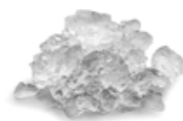
MF 46 Ghiaccio supergranulare Contenuto d'acqua residua 15%