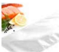
Idonei al contatto alimentare