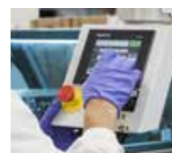
Sistema di gestione qualità delle buste certificato ISO9001