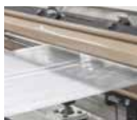
Film provenienti da estrusore "a testa piana"

MIN: 3°C / MAX: 85°C-72h/100°C-2h/121°C-30'