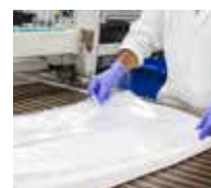
Sacchetti sottovuoto sempre controllati e certificati