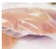
Mantenimento del vuoto nel tempo grazie alla costanza di spessore