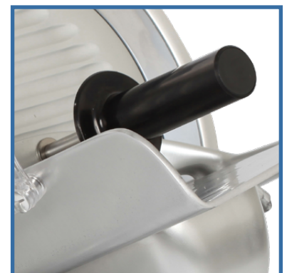
Pressamerce con impugnatura flangiata e prolunga. Food-holder arm with flanged handle and extension.