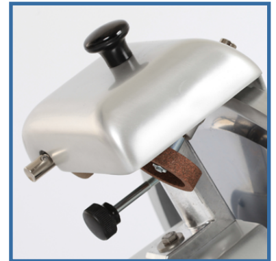
Affilatoio fisso. Fixed sharpener.